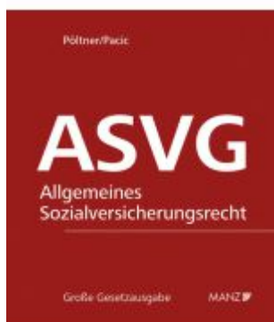
Allgemeine Sozialversicherung ASVG Ladenpreis: 338,00EUR