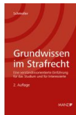
Grundwissen im Strafrecht Ladenpreis: 38,00EUR