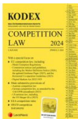
KODEX Competition Law 2024 - inkl. App Ladenpreis: 47,00EUR