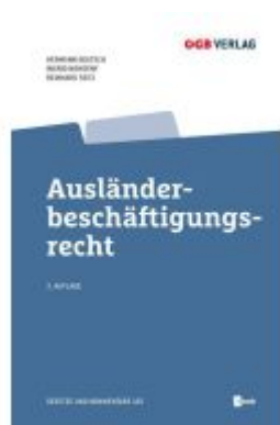
Ausländerbeschäftigungsrecht Ladenpreis: 89,00EUR