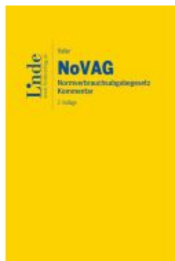
NoVAG | Normverbrauchsabgabengesetz Ladenpreis: 89,00EUR