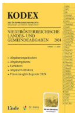
KODEX NÖ Landes- und Gemeindeabgaben Ladenpreis: 26,00EUR