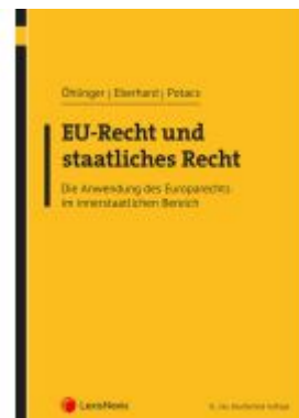
EU-Recht und staatliches Recht Ladenpreis: 54,00EUR