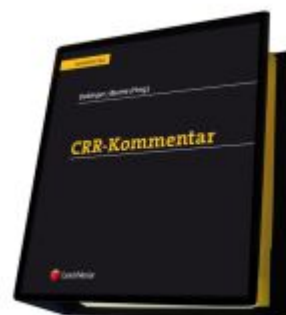
CRR-Kommentar Ladenpreis: 568,00EUR