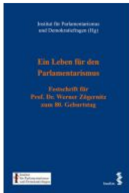
Ein Leben für den Parlamentarismus Ladenpreis: 160,00EUR

Wir haben andere Produkte gefunden, die Ihnen gefallen könnten!