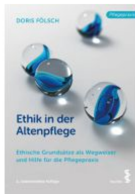
Ethik in der Altenpflege Ladenpreis: 22,90EUR