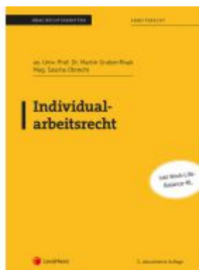
Individualarbeitsrecht (Skriptum) Ladenpreis: 26,25EUR