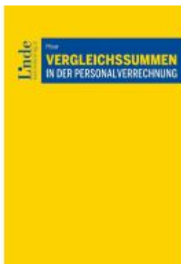
Vergleichssummen in der Personalverrechnung Ladenpreis: 29,00EUR