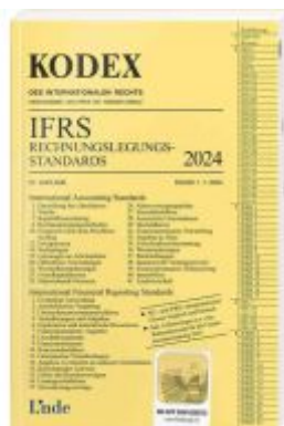
KODEX IFRS - Rechnungslegungsstandards 2024 Ladenpreis: 34,00EUR