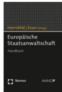
Europäische Staatsanwaltschaft Ladenpreis: 98,00EUR