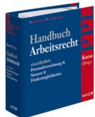
Handbuch Arbeitsrecht Ladenpreis: 198,00EUR

Alle Preise inkl. MwSt. zzgl. Versand. Bei Bestellung im LexisNexis Onlineshop kostenloser Versand innerhalb Österreichs.