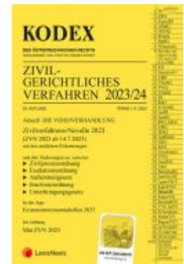
KODEX Zivilgerichtliches Verfahren 2023/24 - inkl. App Ladenpreis: 43,00EUR