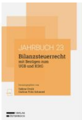
Bilanzsteuerrecht mit Bezügen zum UGB und KStG Ladenpreis: 62,00EUR