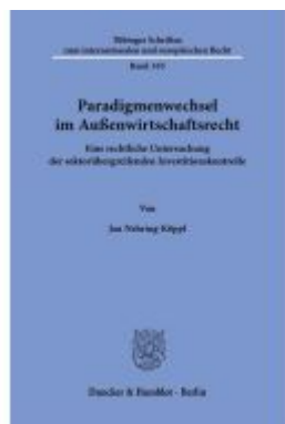
Paradigmenwechsel im Außenwirtschaftsrecht.