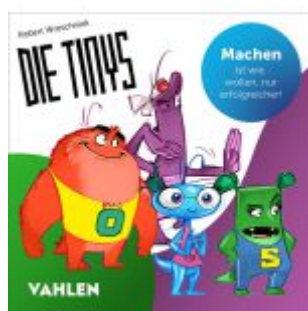
Die TINYS Ladenpreis: 17,40EUR