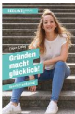
Gründen macht glücklich! Ladenpreis: 22,70EUR