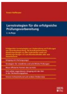
Lernstrategien für die erfolgreiche Prüfungsvorbereitung Ladenpreis: 56,50EUR

Wir haben andere Produkte gefunden, die Ihnen gefallen könnten!