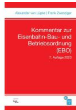
Kommentar zur Eisenbahn-Bau- und Betriebsordnung (EBO)