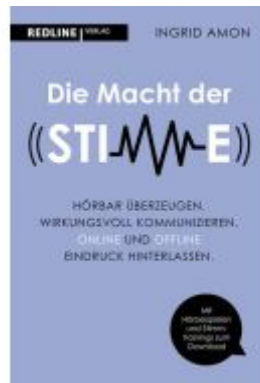
Die Macht der Stimme Ladenpreis: 24,70EUR