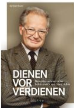
Dienen vor Verdienen Ladenpreis: 36,00EUR