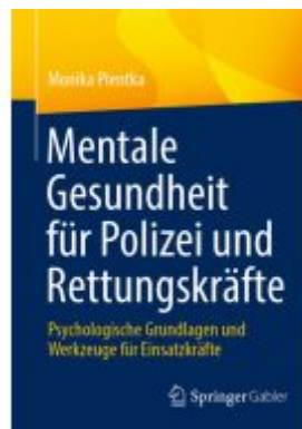
Mentale Gesundheit für Polizei und Rettungskräfte Ladenpreis: 46,25EUR