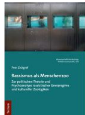
Rassismus als Menschenzoo Ladenpreis: 50,40EUR