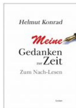
Meine Gedanken zur Zeit Ladenpreis: 18,50 EUR