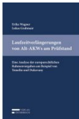
Laufzeitverlängerungen von Alt-AKW's am Prüfstand Ladenpreis: 45,00 EUR