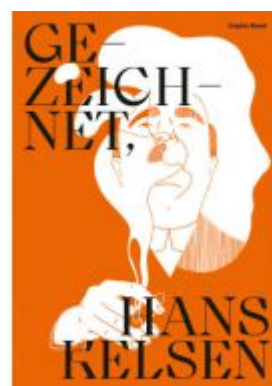
Gezeichnet, Hans Kelsen Ladenpreis: 19,00 EUR