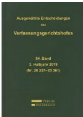
Ausgewählte Entscheidungen des Verfassungsgerichtshofes Ladenpreis: 299,00 EUR

Wir haben andere Produkte gefunden, die Ihnen gefallen könnten!