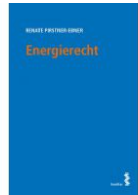
Energierrecht Ladenpreis: 28,00 EUR