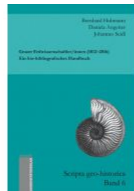
Grazer Erdwissenschaftler/innen (1812–2016). Ein bio-bibliografisches Handbuch Ladenpreis: 22,90 EUR