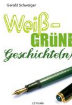
Weiß-grüne Geschichte(n) Ladenpreis: 9,90 EUR