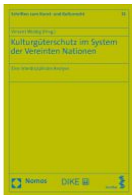
Kulturgüterschutz im System der Vereinten Nationen Ladenpreis: 56,60EUR