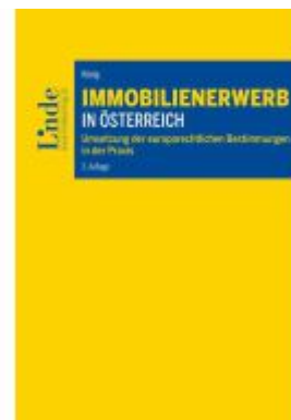
Immobilienwerb in Österreich Ladenpreis: 60,00EUR