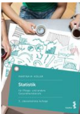
Statistik für Pflege- und andere Gesundheitsberufe Ladenpreis: 26,90EUR