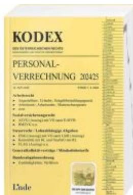
KODEX Personalverrechnung 2024/25 Ladenpreis: 45,00EUR