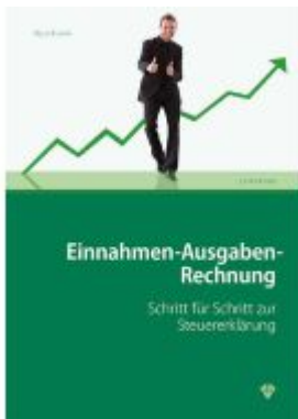
Einnahmen-Ausgaben-Rechnung Ladenpreis: 28,00EUR

Wir haben andere Produkte gefunden, die Ihnen gefallen könnten!