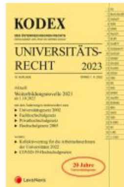
KODEX Universitätsrecht 2023 Ladenpreis: 62,00EUR