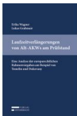
Laufzeitverlängerungen von Alt-AKW's am Prüfstand Ladenpreis: 45,00 EUR