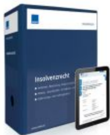
Insolvenzrecht Ladenpreis: 228,90 EUR

Wir haben andere Produkte gefunden, die Ihnen gefallen könnten!