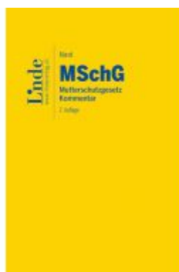
MSchG | Mutterschutzgesetz Ladenpreis: 69,00 EUR