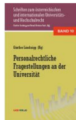
Personalrechtliche Fragestellungen an der Universität Ladenpreis: 36,00 EUR