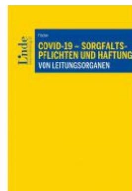
COVID-19 - Sorgfaltspflichten und Haftung von Leitungsorganen Ladenpreis: 39,00 EUR