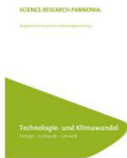
Technologie und Klimawandel (FH Burgenland Bd. 22) Ladenpreis: 45,00 EUR