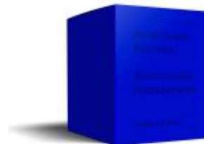
Relationale Führung, Relationales Management. Ladenpreis: 319,00EUR