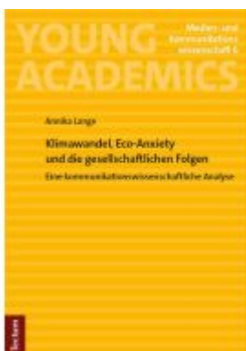
Klimawandel, Eco-Anxiety und die gesellschaftlichen Folgen Ladenpreis: 24,70EUR