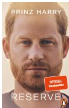
Reserve Ladenpreis: 13,40EUR