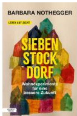
Sieben Stock Dorf Ladenpreis: 25,00EUR