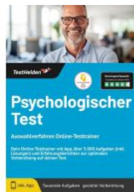
Psychologischer Test Auswahlverfahren Online-Testtrainer - Dein Online- Testtrainer mit App, über 5.000 Aufgaben (inkl. Lösungen) und Erfahrungsberichten zur optimalen Vorbereitung auf deinen Test Ladenpreis: 41,10EUR