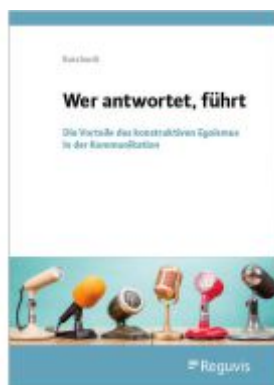
Wer antwortet, führt Ladenpreis: 50,40EUR