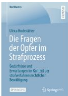
Die Fragen der Opfer im Strafprozess Ladenpreis: 43,99EUR