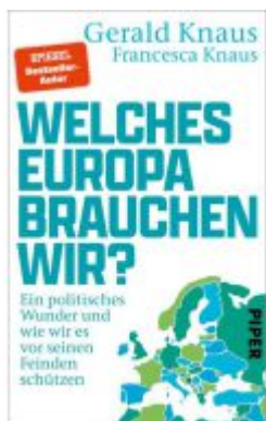
Welches Europa brauchen wir? Ladenpreis: 24,70EUR