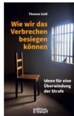
Wie wir das Verbrechen besiegen können Ladenpreis: 24,70EUR