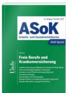
ASoK-Spezial Freie Berufe und Krankenversicherung Ladenpreis: 24,00 EUR