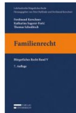
Familienrecht Ladenpreis: 28,00 EUR