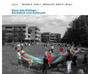
Haus des Dialogs – Rückblick und Aufbruch Ladenpreis: 19,90 EUR