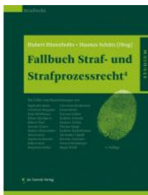
Fallbuch Straf- und Strafprozessrecht4 Ladenpreis: 42,50 EUR