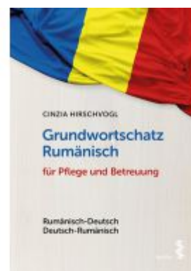
Grundwortschatz Rumänisch für Pflege und Betreuung Ladenpreis: 18,90 EUR