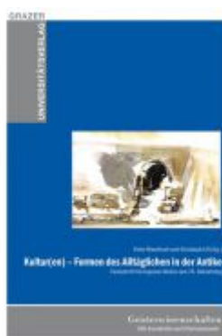
Kultur(en) – Formen des Alltäglichen in der Antike Ladenpreis: 49,90 EUR