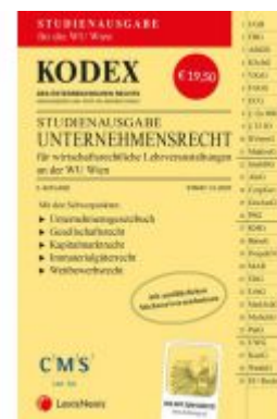
KODEX Unternehmensrecht für wirtschaftsrechtliche LVA 2020/21 Ladenpreis: 19,50 EUR