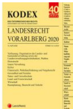
KODEX Landesrecht Vorarlberg 2020 Ladenpreis: 115,00 EUR

Wir haben andere Produkte gefunden, die Ihnen gefallen könnten!