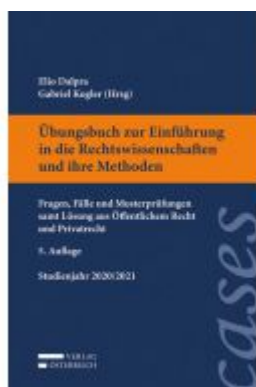
Übungsbuch zur Einführung in die Rechtswissenschaften und ihre Methoden Ladenpreis: 28,00 EUR