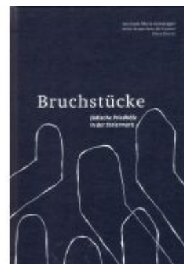
Bruchstücke Ladenpreis: 24,90 EUR