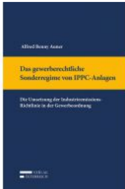
Das gewerberechtliche Sonderregime von IPPC-Anlagen Ladenpreis: 129,00 EUR