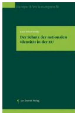
Der Schutz der nationalen Identität in der EU Ladenpreis: 78,00 EUR