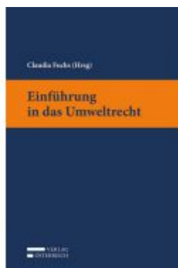
Einführung in das Umweltrecht Ladenpreis: 28,00 EUR