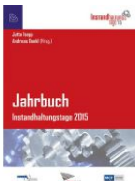
Jahrbuch Instandhaltungstage 2015 Ladenpreis: 54,90 EUR