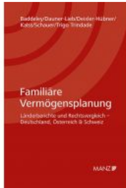
Familiäre Vermögensplanung Ladenpreis: 148,00 EUR