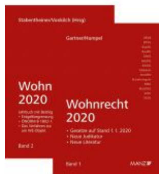
PAKET: Wohnrecht 2020 Band 1 + 2 Ladenpreis: 74,00 EUR