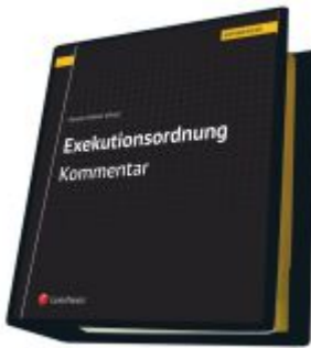
Exekutionsordnung - Kommentar Ladenpreis: 623,00 EUR