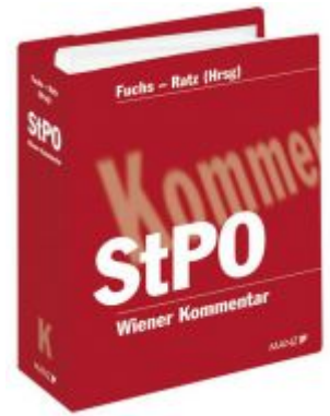
Wiener Kommentar zur StPO Ladenpreis: 398,00 EUR