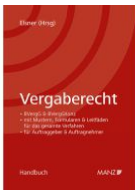
Vergaberecht Ladenpreis: 128,00EUR