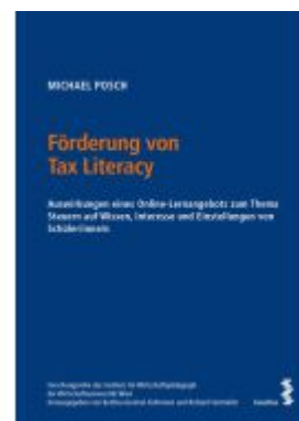
Förderung von Tax Literacy Ladenpreis: 63,00EUR