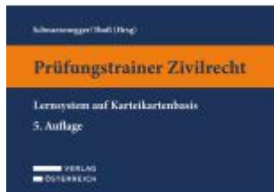
Prüfungstrainer Zivilrecht Ladenpreis: 49,00EUR

Wir haben andere Produkte gefunden, die Ihnen gefallen könnten!