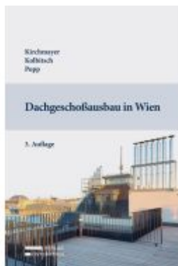
Dachgeschoßausbau in Wien Ladenpreis: 79,00EUR