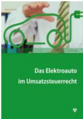
Das Elektroauto im Umsatzsteuerrecht Ladenpreis: 24,00EUR