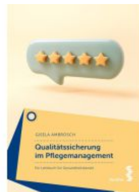
Qualitätssicherung im Pflegemanagement Ladenpreis: 24,90EUR