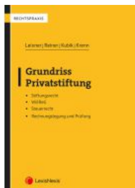
Grundriss Privatstiftung Ladenpreis: 29,00EUR