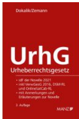
Urheberrechtsgesetz Ladenpreis: 74,00EUR