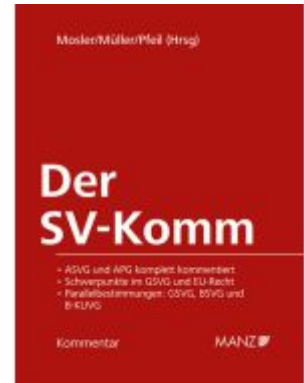
Der SV-Komm Ladenpreis: 398,00EUR