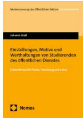
Einstellungen, Motive und Werthaltungen von Studierenden des öffentlichen Dienstes Ladenpreis: 91,50EUR