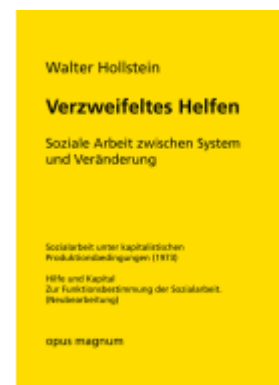
Verzweifeltes Helfen Ladenpreis: 20,50EUR