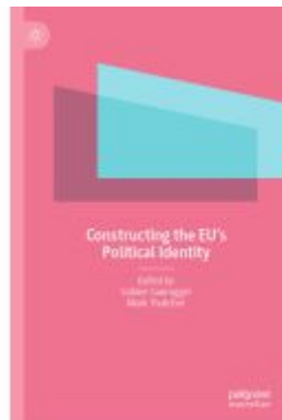
Constructing the EU's Political Identity Ladenpreis: 120,99EUR