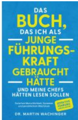
Das Buch, das ich als junge Führungskraft gebraucht hätte und meine Chefs hätten lesen sollen Ladenpreis: 19,20EUR