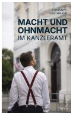
Macht und Ohnmacht im Kanzleramt Ladenpreis: 27,00EUR

Wir haben andere Produkte gefunden, die Ihnen gefallen könnten!