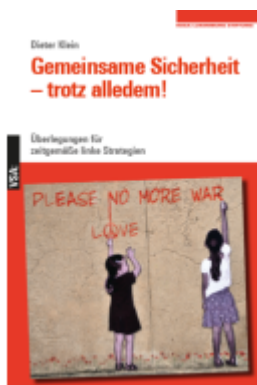
Gemeinsame Sicherheit - trotz alledem Ladenpreis: 17,30EUR