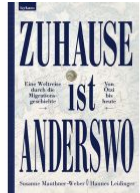
Zuhause ist anderswo Ladenpreis: 28,00EUR