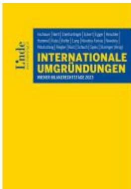
Internationale Umgründungen Ladenpreis: 58,00EUR

Wir haben andere Produkte gefunden, die Ihnen gefallen könnten!