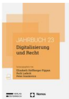
Digitalisierung und Recht Ladenpreis: 98,00EUR