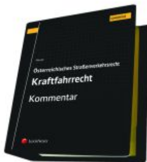
Österreichisches Straßenverkehrsrecht - Kraftfahrrecht Ladenpreis: 623,75EUR