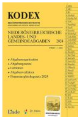
KODEX NÖ Landes- und Gemeindeabgaben Ladenpreis: 26,00EUR