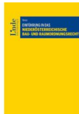
Einführung in das niederösterreichische Bau- und Raumordnungsrecht Ladenpreis: 56,00EUR