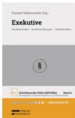
Exekutive Ladenpreis: 94,00EUR