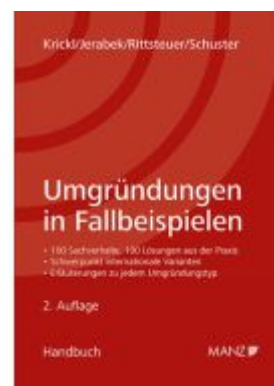
Umgründungen in Fallbeispielen Ladenpreis: 74,00EUR