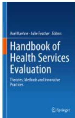
Handbook of Health Services Evaluation Ladenpreis: 219,99EUR