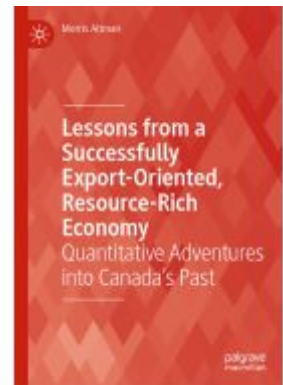
Lessons from a Successfully Export- Oriented, Resource-Rich Economy Ladenpreis: 109,99EUR