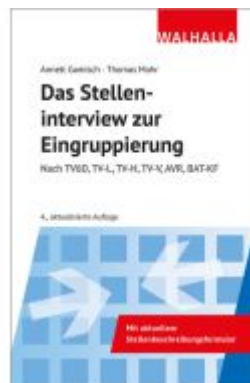
Das Stelleninterview zur Eingruppierung Ladenpreis: 17,50EUR