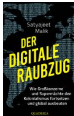
Der digitale Raubzug Ladenpreis: 25,70EUR