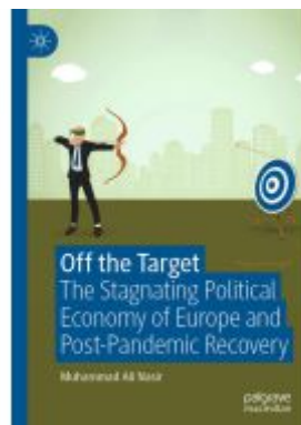
Off the Target Ladenpreis: 120,99EUR