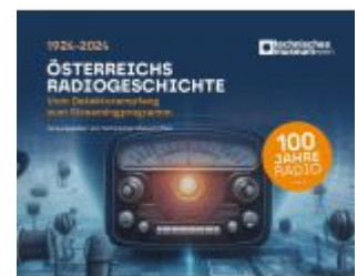
Österreichs Radiogesichte Ladenpreis: 29,95EUR