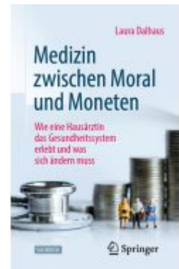
Medizin zwischen Moral und Moneten Ladenpreis: 25,69EUR