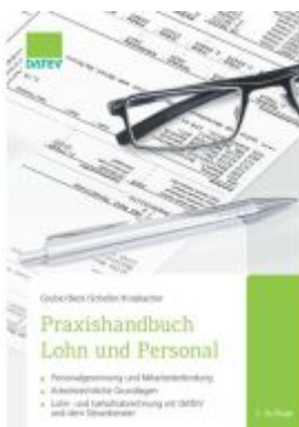
Praxishandbuch Lohn und Personal Ladenpreis: 30,83EUR