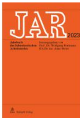
JAR 2023 Ladenpreis: 282,10EUR