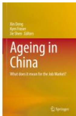
Ageing in China Ladenpreis: 197,99EUR