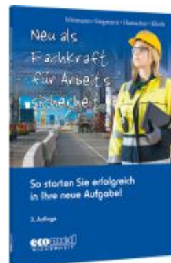
Neu als Fachkraft für Arbeitssicherheit Ladenpreis: 30,90EUR