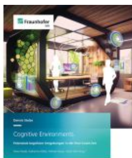
Cognitive Environments Ladenpreis: 71,00EUR