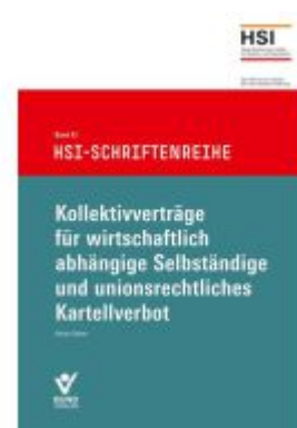
Kollektivverträge für wirtschaftlich abhängige Selbständige und unionsrechtliches Kartellverbot Ladenpreis: 20,40EUR