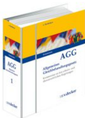
Allgemeines Gleichbehandlungsgesetz - AGG Ladenpreis: 552,10EUR