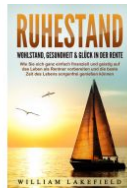
RUHESTAND - Wohlstand, Gesundheit & Glück in der Rente: Wie Sie sich ganz einfach finanziell und geistig auf das Leben als Rentner vorbereiten und die beste Zeit des Lebens sorgenfrei genießen können Ladenpreis: 16,40EUR