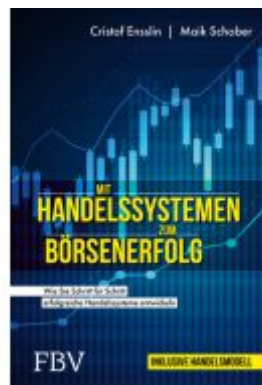
Mit Handelssystemen zum Börsenerfolg Ladenpreis: 30,90EUR