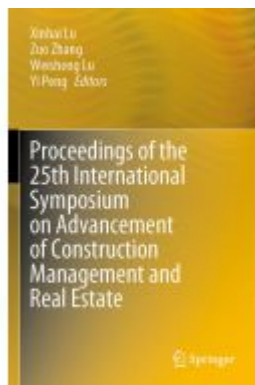
Proceedings of the 25th International Symposium on Advancement of Construction Management and Real Estate Ladenpreis: 241,99EUR