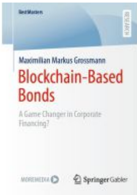
Blockchain-Based Bonds Ladenpreis: 98,99EUR