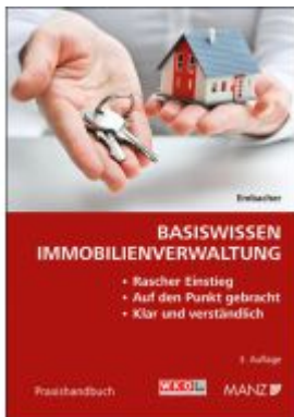
Basiswissen Immobilienverwaltung Ladenpreis: 44,00EUR