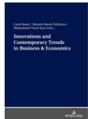
Innovations and Contemporary Trends in Business & Economics Ladenpreis: 46,20EUR