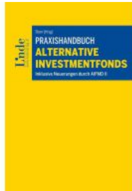
Praxishandbuch Alternative Investmentfonds Ladenpreis: 119,00EUR