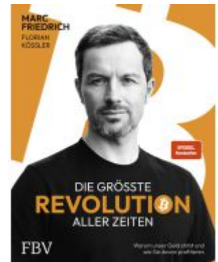
Die größte Revolution aller Zeiten Ladenpreis: 30,90EUR