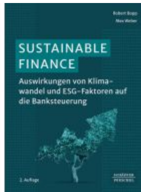
Sustainable Finance Ladenpreis: 72,00EUR