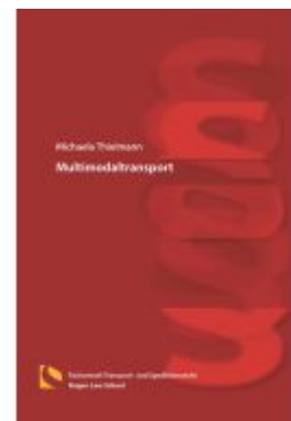
Multimodaltransport Ladenpreis: 25,70EUR