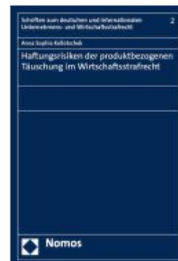
Haftungsrisiken der produktbezogenen Täuschung im Wirtschaftsstrafrecht Ladenpreis: 112,10EUR