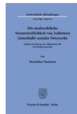
Die strafrechtliche Verantwortlichkeit von Anbietern (innerhalb) sozialer Netzwerke Ladenpreis: 133,60EUR