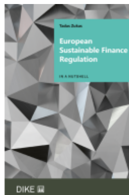
European Sustainable Finance Regulation Ladenpreis: 64,00EUR