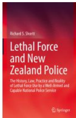
Lethal Force and New Zealand Police Ladenpreis: 142,99EUR