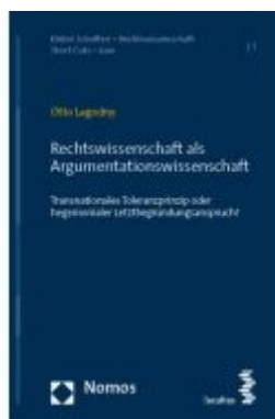
Rechtswissenschaft als Argumentationswissenschaft Ladenpreis: 29,90EUR