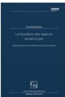
La liquidation des rapports de bail à loyer Ladenpreis: 99,00EUR