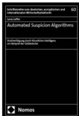
Automated Suspicion Algorithms Ladenpreis: 107,00EUR