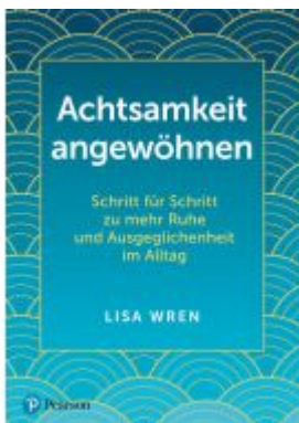
Achtsamkeit angewöhnen Ladenpreis: 19,95EUR