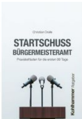
Startschuss Bürgermeisteramt Ladenpreis: 25,70EUR

Wir haben andere Produkte gefunden, die Ihnen gefallen könnten!