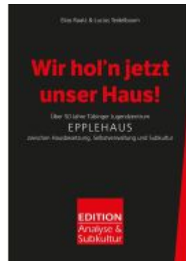
Wir hol'n jetzt unser Haus! Ladenpreis: 41,00EUR