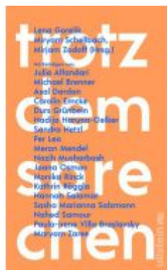
Trotzdem sprechen Ladenpreis: 22,70EUR