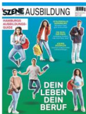
SZENE HAMBURG AUSBILDUNG 2024/2025