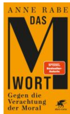
Das M-Wort Ladenpreis: 20,60EUR