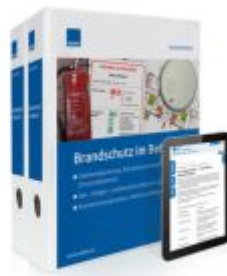
Brandschutz im Betrieb Ladenpreis: 239,80EUR