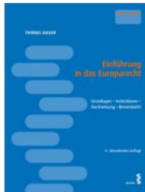
Einführung in das Europarecht Ladenpreis: 27,00EUR