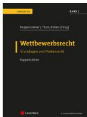
Wettbewerbsrecht - Band 1