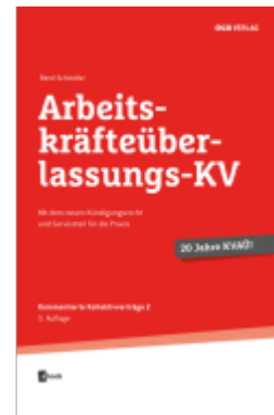
Arbeitskräfteüberlassungs-KV Ladenpreis: 42,00EUR