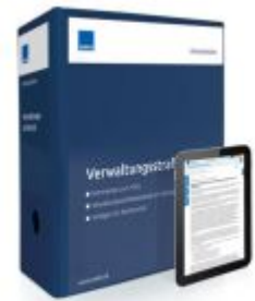
Verwaltungsstrafrecht Ladenpreis: 250,80EUR