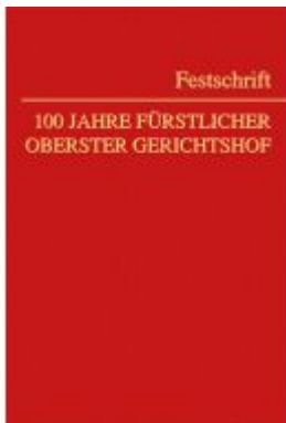
100 Jahre Fürstlicher Oberster Gerichtshof Ladenpreis: 110,00EUR

Wir haben andere Produkte gefunden, die Ihnen gefallen könnten!