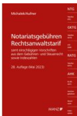
Notariatsgebühren - Rechtsanwaltstarif