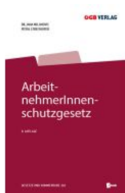
ArbeitnehmerInnenschutzgesetz Ladenpreis: 109,00EUR