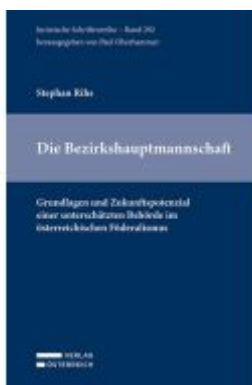
Die Bezirkshauptmannschaft Ladenpreis: 59,00EUR