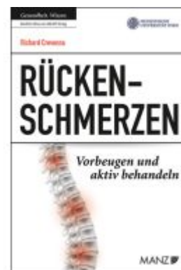
Rückenschmerzen Vorbeugen und aktiv behandeln Ladenpreis: 23,90EUR