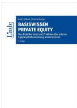
Basiswissen Private Equity Ladenpreis: 42,00EUR

Wir haben andere Produkte gefunden, die Ihnen gefallen könnten!