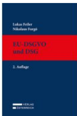
EU-DSGVO und DSGVO Ladenpreis: 124,00EUR