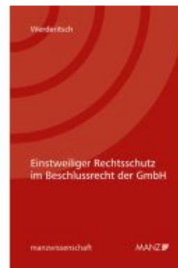
Einstweiliger Rechtsschutz im Beschlussrecht der GmbH Ladenpreis: 48,00EUR