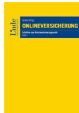
Onlineversicherung Ladenpreis: 38,00EUR