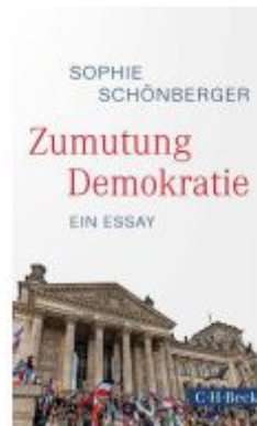
Zumutung Demokratie Ladenpreis: 16,50EUR