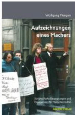
Aufzeichnungen eines Machers Ladenpreis: 18,00EUR