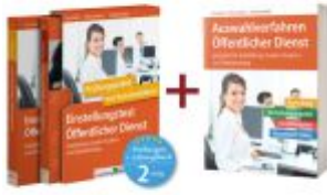
Sparpaket – Einstellungstest + Auswahlverfahren Öffentlicher Dienst Ladenpreis: 51,30EUR