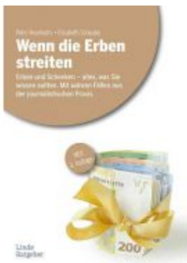
Wenn die Erben streiten Ladenpreis: 24,90EUR