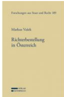
Richterbestellung in Österreich Ladenpreis: 114,00EUR