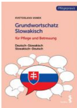
Grundwortschatz Slowakisch für Pflege- und Gesundheitsberufe Ladenpreis: 9,90EUR

Wir haben andere Produkte gefunden, die Ihnen gefallen könnten!