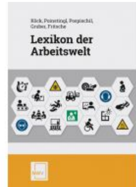
Lexikon der Arbeitswelt Ladenpreis: 69,00EUR