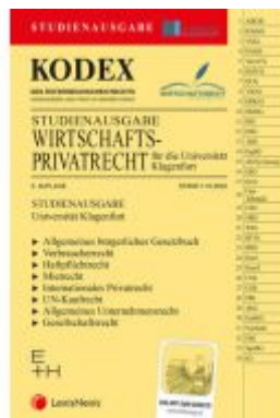
KODEX Wirtschaftsprivatright Klagenfurt 2022 - inkl. App Ladenpreis: 23,00EUR