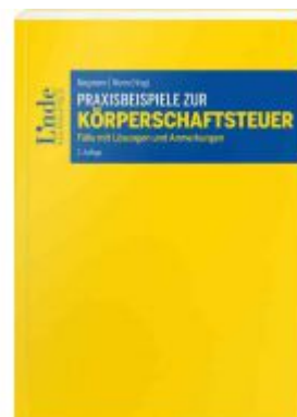
Praxisbeispiele zur Körperschaftsteuer Ladenpreis: 45,00EUR