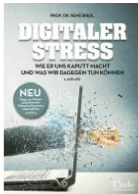
Digitaler Stress Ladenpreis: 22,00EUR