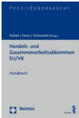
Handels- und Zusammenarbeitsabkommen EU/VK Ladenpreis: 100,80EUR