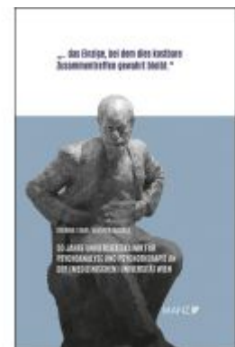
50 Jahre Universitätsklinik für Psychoanalyse und Psychotherapie an der (Medizinischen) Universität Wien Ladenpreis: 38,00EUR