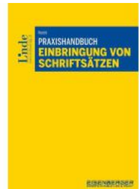
Praxishandbuch Einbringung von Schriftsätzen Ladenpreis: 79,00EUR