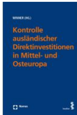
Kontrolle ausländischer Direktinvestitionen in Mittel- und Osteuropa Ladenpreis: 92,00EUR