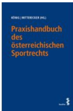
Praxishandbuch des österreichischen Sportrechts Ladenpreis: 220,00EUR