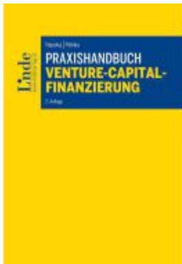
Praxishandbuch Venture-Capital- Finanzierung Ladenpreis: 59,00EUR