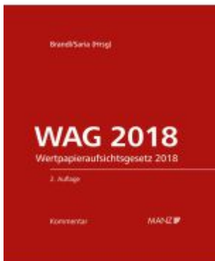
WAG 2018 2.Auflage Ladenpreis: 348,00EUR

Wir haben andere Produkte gefunden, die Ihnen gefallen könnten!