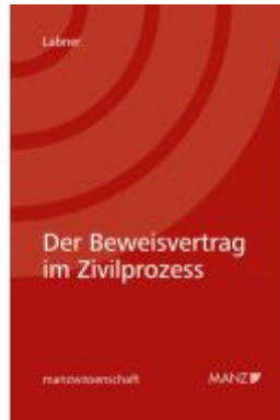
Der Beweisvertrag im Zivilprozess Ladenpreis: 52,00EUR