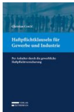
Haftpflichtklauseln für Gewerbe und Industrie Ladenpreis: 49,00EUR