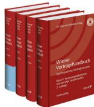
PAKET: Wiener Vertragshandbuch Ladenpreis: 678,00 EUR