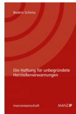
Die Haftung für unbegründete Herstellerverwarnungen Ladenpreis: 46,00 EUR