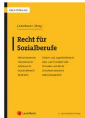
Recht für Sozialberufe