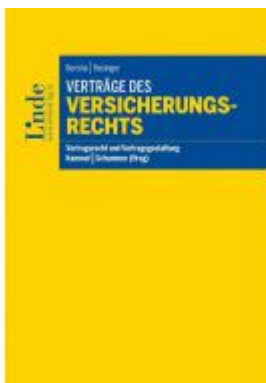
Verträge des Versicherungsrechts Ladenpreis: 48,00 EUR