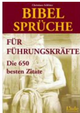
Bibelsprüche für Führungskräfte Ladenpreis: 18,50 EUR