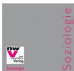
Woraufhin wir integrieren

Toleranz als Leitidee einer modernen Gesellschaft