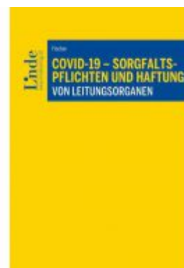
COVID-19 - Sorgfaltspflichten und Haftung von Leitungsorganen Ladenpreis: 39,00 EUR