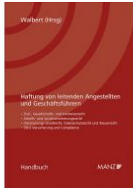
Haftung von leitenden Angestellten und Geschäftsführern Ladenpreis: 98,00 EUR