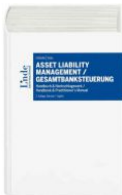
Asset Liability Management / Gesamtbanksteuerung Ladenpreis: 179,00 EUR