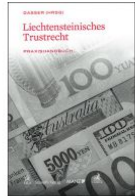
Liechtensteinisches Trustrecht Ladenpreis: 99,00 EUR