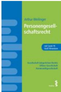
Personengesellschaftsrecht Ladenpreis: 24,00 EUR