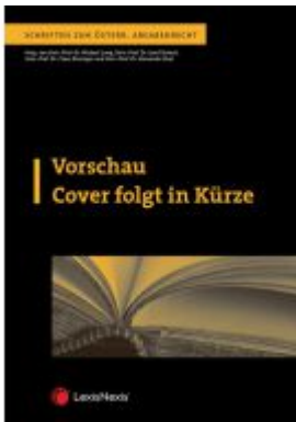
Eigene Anteile im Steuerrecht Ladenpreis: 42,00 EUR