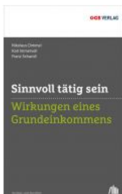
Sinnvoll tätig sein Ladenpreis: 29,90 EUR