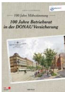
100 Jahre Mitbestimmung Ladenpreis: 29,90 EUR