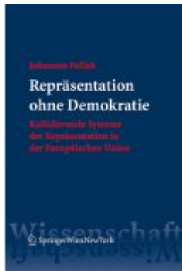
Repräsentation ohne Demokratie Ladenpreis: 89,95 EUR

Wir haben andere Produkte gefunden, die Ihnen gefallen könnten!