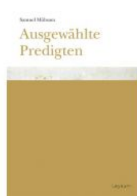
Samuel Mühsam. Ausgewählte Predigten Ladenpreis: 18,00 EUR