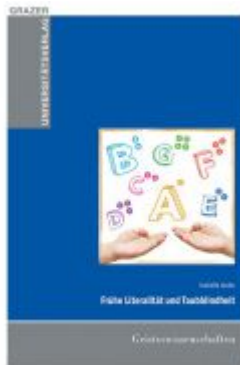
Frühe Literalität und Taubblindheit Ladenpreis: 12,90 EUR