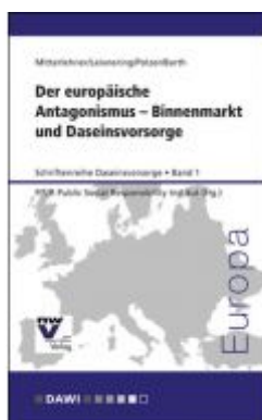
Der europäische Antagonismus – Binnenmarkt und Daseinsvorsorge Ladenpreis: 36,00 EUR