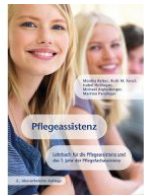
Pflegeassistenz Ladenpreis: 49,90 EUR