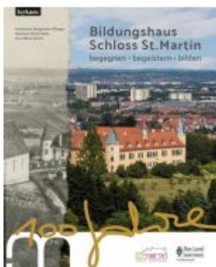
Bildungshaus Schloss St. Martin - 100 Jahre - begegnen - begeistern - bilden Ladenpreis: 25,00 EUR