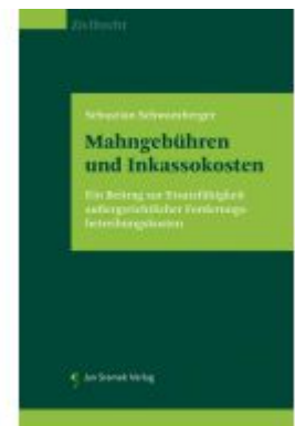
Mahngebühren und Inkassokosten Ladenpreis: 59,90EUR