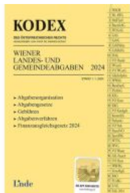
KODEX Wiener Landes- und Gemeindeabgaben Ladenpreis: 29,00EUR