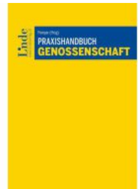
Praxishandbuch Genossenschaft Ladenpreis: 78,00EUR