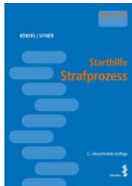
Starthilfe Strafprozess Ladenpreis: 26,00EUR