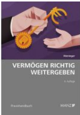
Vermögen richtig weitergeben Ladenpreis: 39,00EUR