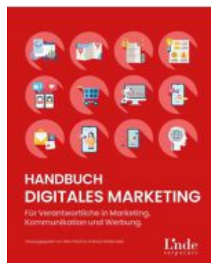
Handbuch Digitales Marketing Ladenpreis: 39,90EUR