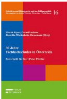
30 Jahre Fachhochschulen in Österreich Ladenpreis: 95,00EUR