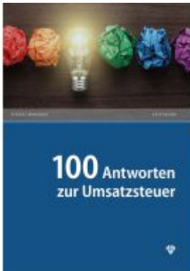
100 Antworten zur Umsatzsteuer Ladenpreis: 39,60EUR