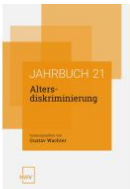
Altersdiskriminierung Ladenpreis: 64,00EUR