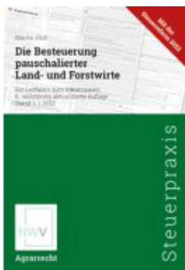
Die Besteuerung pauschalierter Land- und Forstwirte Ladenpreis: 128,00EUR