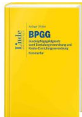
BPGG | Bundespflegegeldgesetz Ladenpreis: 59,00EUR