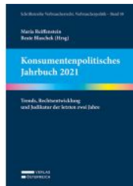
Konsumentenpolitisches Jahrbuch 2021 Ladenpreis: 89,00EUR