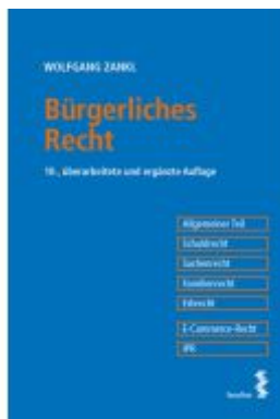
Bürgerliches Recht Ladenpreis: 58,00EUR