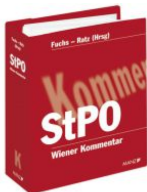
Wiener Kommentar zur StPO Ladenpreis: 478,00EUR