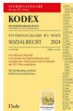
KODEX Studienausgabe Sozialrecht WU 2024 Ladenpreis: 15,00EUR