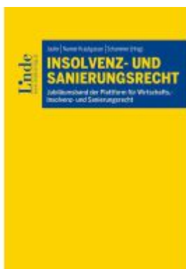
Insolvenz- und Sanierungsrecht Ladenpreis: 69,00EUR