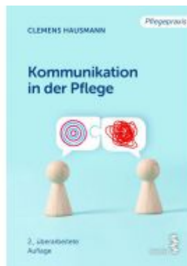
Kommunikation in der Pflege Ladenpreis: 16,90 EUR