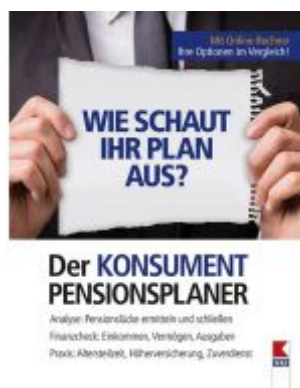
Der KONSUMENT-Pensionsplaner Ladenpreis: 19,90 EUR