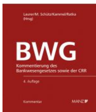
Bankwesengesetz - BWG 4.Auflage Ladenpreis: 378,00 EUR