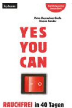
YES YOU CAN. Rauchfrei in 40 Tagen. Ladenpreis: 16,90 EUR