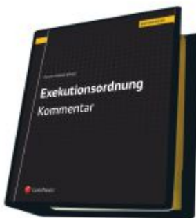
Exekutionsordnung - Kommentar Ladenpreis: 623,00 EUR