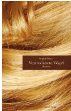
Vertrocknete Vögel Ladenpreis: 14,90 EUR