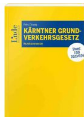
Kärntner Grundverkehrsgesetz Ladenpreis: 48,00 EUR