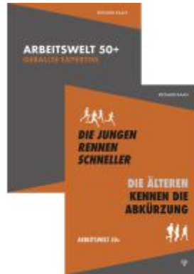
Arbeitswelt 50+: Band 1 und 2 im Set Ladenpreis: 49,50EUR