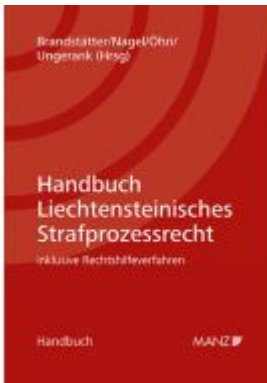
Handbuch Liechtensteinisches Strafprozessrecht Ladenpreis: 224,00EUR