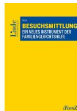
Besuchsmittlung Ladenpreis: 48,00EUR