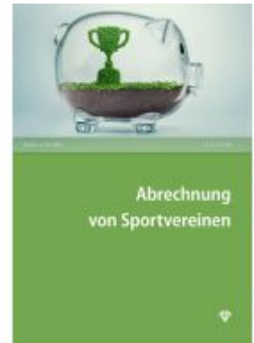
Abrechnung von Sportvereinen Ladenpreis: 27,50EUR