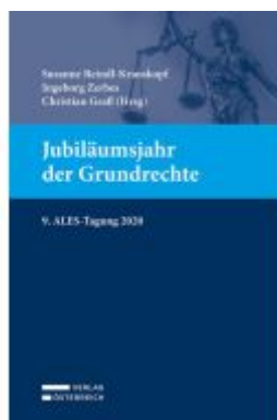
Jubiläumjahr der Grundrechte Ladenpreis: 49,00EUR