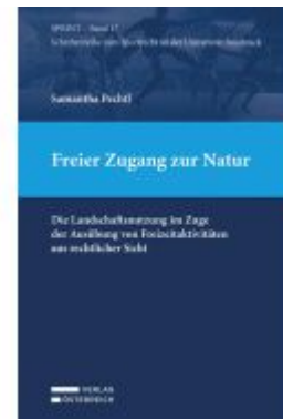
Freier Zugang zur Natur Ladenpreis: 79,00EUR