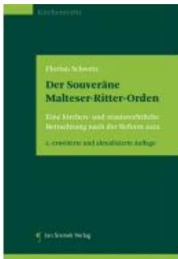
Der Souveräne Malteser-Ritter-Orden Ladenpreis: 59,90EUR

Wir haben andere Produkte gefunden, die Ihnen gefallen könnten!