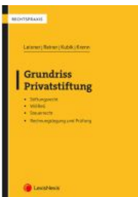
Grundriss Privatstiftung Ladenpreis: 29,00EUR