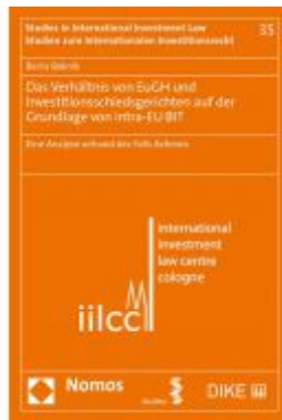
Das Verhältnis von EuGH und Investitionsschiedsgerichten auf der Grundlage von intra-EU BIT Ladenpreis: 100,80 EUR