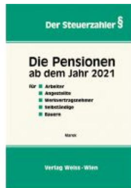
Die Pensionen ab dem Jahr 2021 Ladenpreis: 47,30 EUR