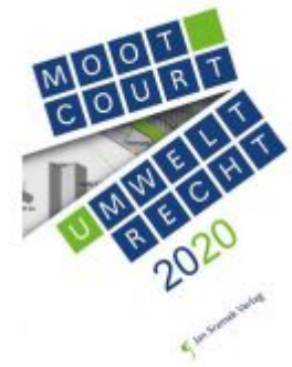
Moot Court - Umweltrecht 2020 Ladenpreis: 55,00 EUR