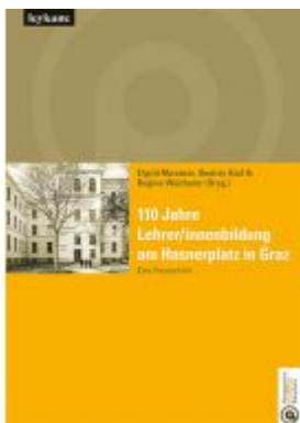
110 Jahre Lehrer/innenbildung am Hasnerplatz in Graz – Eine Festschrift Ladenpreis: 25,00 EUR