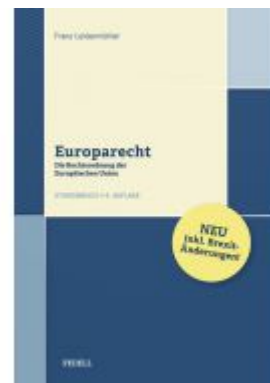
Europarecht Ladenpreis: 45,00 EUR