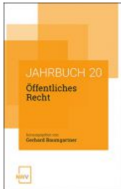
Öffentliches Recht Ladenpreis: 68,00 EUR