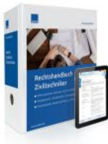
Rechtshandbuch Ziviltechniker Ladenpreis: 207,90 EUR