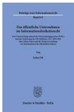
Das öffentliche Unternehmen im Informationsfreiheitsrecht.