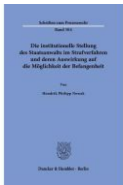
Die institutionelle Stellung des Staatsanwalts im Strafverfahren und deren Auswirkung auf die Möglichkeit der Befangenheit Ladenpreis: 71,90EUR