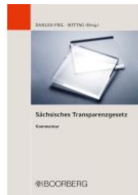
Sächsisches Transparenzgesetz Ladenpreis: 55,60EUR