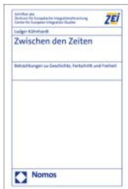
Zwischen den Zeiten Ladenpreis: 142,90EUR