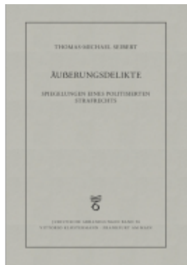
Äußerungsdelikte Ladenpreis: 91,50EUR