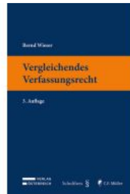
Vergleichendes Verfassungsrecht Ladenpreis: 55,00EUR