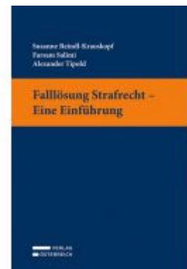
Falllösung Strafrecht - Eine Einführung Ladenpreis: 32,00 EUR