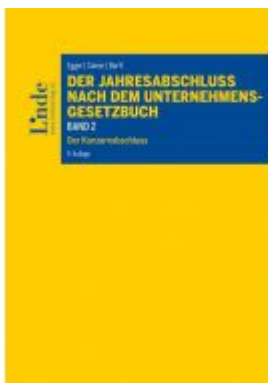
Der Jahresabschluss nach dem Unternehmensgesetzbuch, Band 2 Ladenpreis: 90,00 EUR