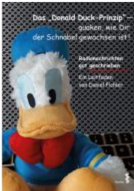
Das Donald Duck-Prinzip – quaken, wie Dir der Schnabel gewachsen ist! Ladenpreis: 13,40 EUR