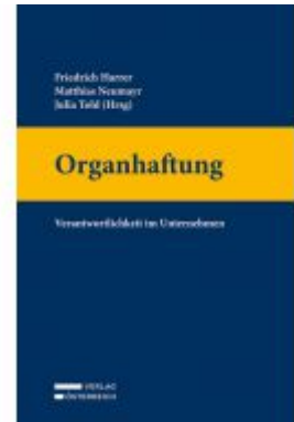
Organhaftung Ladenpreis: 198,00 EUR