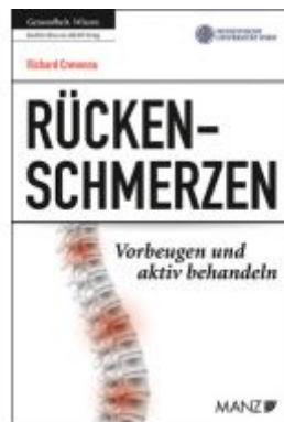
Rückenschmerzen Vorbeugen und aktiv behandeln Ladenpreis: 23,90 EUR