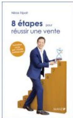
8 étapes pour réussir une vente Ladenpreis: 28,90 EUR