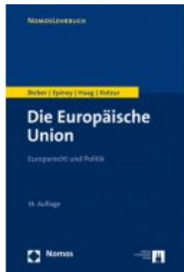
Die Europäische Union Ladenpreis: 39,10 EUR