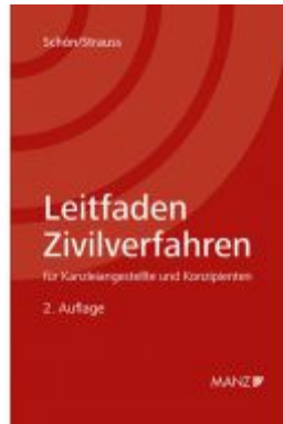
Leitfaden Zivilverfahren für Kanzleiangestellte und Konzipienten Ladenpreis: 29,00 EUR