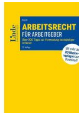
Arbeitsrecht für Arbeitgeber Ladenpreis: 104,00EUR