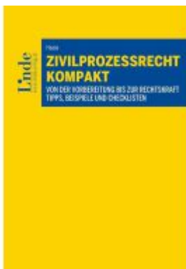
Zivilprozessrecht kompakt Ladenpreis: 30,00EUR