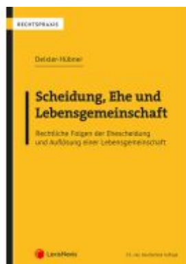
Scheidung, Ehe und Lebensgemeinschaft Ladenpreis: 79,00EUR