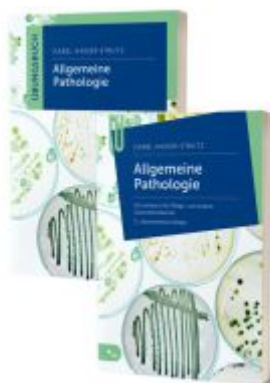
Lernpaket Allgemeine Pathologie Ladenpreis: 41,90EUR