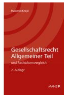
Gesellschaftsrecht Allgemeiner Teil Ladenpreis: 69,00EUR