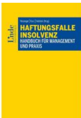
Haftungsfälle Insolvenz Ladenpreis: 49,00EUR