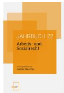
Arbeits- und Sozialrecht Ladenpreis: 64,00EUR