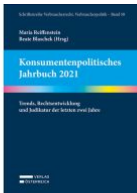
Konsumentenpolitisches Jahrbuch 2021 Ladenpreis: 89,00EUR