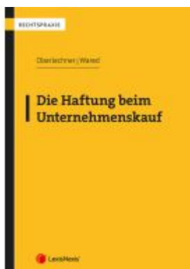
Die Haftung beim Unternehmenskauf Ladenpreis: 57,00EUR