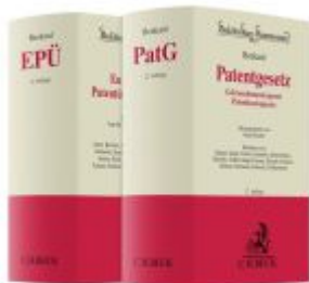
Bundle Benkard, Patentgesetz + Benkard, Europäisches Patentübereinkommen Ladenpreis: 482,20EUR