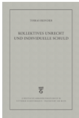
Kollektives Unrecht und individuelle Schuld Ladenpreis: 91,50EUR