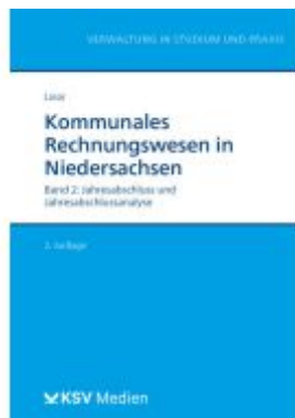
Kommunales Rechnungswesen in Niedersachsen (Bd. 2/2) Ladenpreis: 41,20EUR