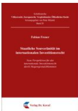
Staatliche Souveränität im internationalen Investitionsrecht Ladenpreis: 99,60EUR