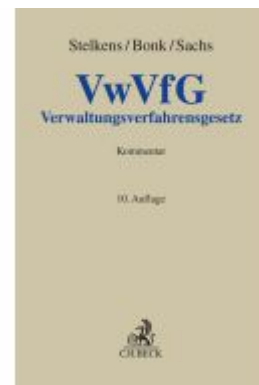
Verwaltungsverfahrensgesetz Ladenpreis: 214,90EUR