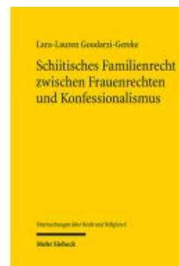
Schiitisches Familienrecht zwischen Frauenrechten und Konfessionalismus Ladenpreis: 91,50EUR