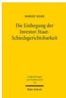
Die Einhebung der Investor-Staat- Schiedsgerichtsbarkeit Ladenpreis: 91,50EUR