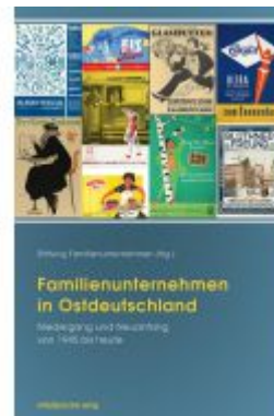
Familienunternehmen in Ostdeutschland Ladenpreis: 35,00EUR