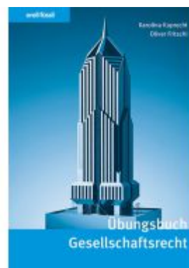
Übungsbuch Gesellschaftsrecht Ladenpreis: 39,10EUR