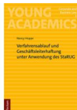
Verfahrensablauf und Geschäftsleiterhaftung unter Anwendung des StaRUG Ladenpreis: 24,70EUR