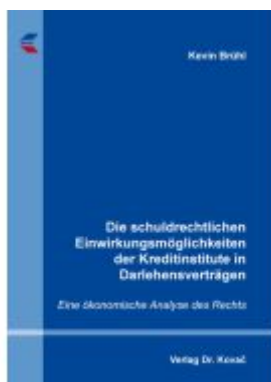
Die schuldrechtlichen Einwirkungsmöglichkeiten der Kreditinstitute in Darlehensverträgen Ladenpreis: 102,60EUR