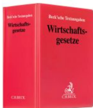
Wirtschaftsgesetze Ladenpreis: 60,70EUR