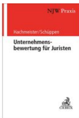
Unternehmensbewertung für Juristen Ladenpreis: 60,70EUR