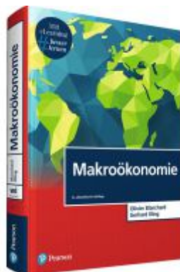
Makroökonomie Ladenpreis: 54,95EUR