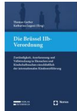
Die Brüssel IIb-Verordnung Ladenpreis: 149,00EUR