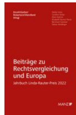
Beiträge zu Rechtsvergleichung und Europa Jahrbuch Linda-Rauter-Preis 2022 Ladenpreis: 89,00EUR