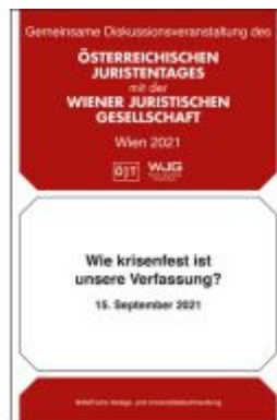
Wie krisenfest ist unsere Verfassung? Diskussionsveranstaltung vom 15. September 2021 Ladenpreis: 19,00EUR