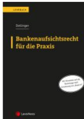
Bankenaufsichtsrecht für die Praxis Ladenpreis: 59,00EUR