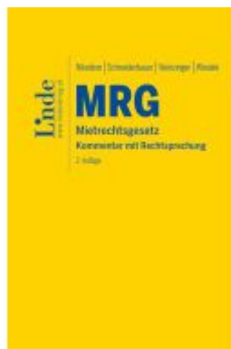
MRG | Mietrechtsgesetz Ladenpreis: 128,00EUR