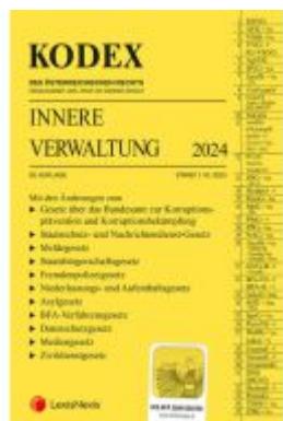
KODEX Innere Verwaltung 2024 - inkl. App Ladenpreis: 103,00EUR