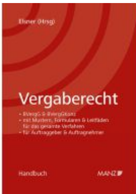
Vergaberecht Ladenpreis: 128,00EUR

Wir haben andere Produkte gefunden, die Ihnen gefallen könnten!