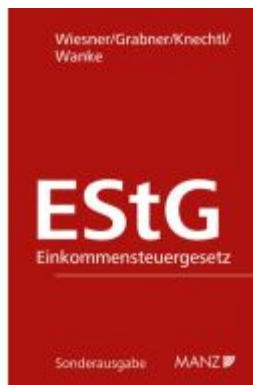
Einkommensteuergesetz EStG Ladenpreis: 448,00EUR