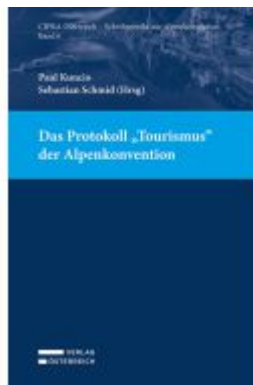
Das Protokoll "Tourismus" der Alpenkonvention Ladenpreis: 42,00EUR