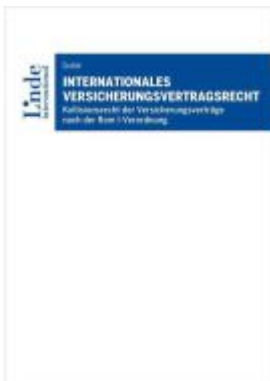
Internationales Versicherungsvertragsrecht Ladenpreis: 68,00EUR