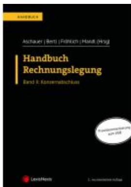
Handbuch Rechnungslegung / Handbuch Rechnungslegung, Band II: Konzernabschluss Ladenpreis: 99,00EUR