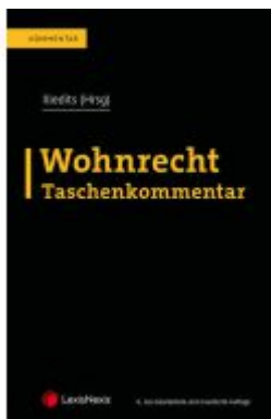
Wohnrecht Taschenkommentar Ladenpreis: 229,00EUR