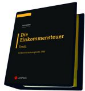
Die Einkommensteuer (EStG 1988) Band I - Texte Ladenpreis: 298,00EUR