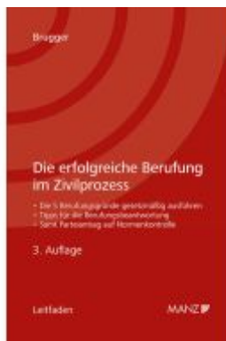
Die erfolgreiche Berufung im Zivilprozess Ladenpreis: 39,00EUR