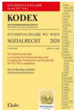
KODEX Studienausgabe Sozialrecht WU 2024 Ladenpreis: 15,00EUR