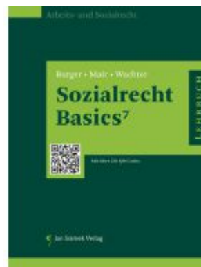
Sozialrecht Basics Ladenpreis: 39,90EUR