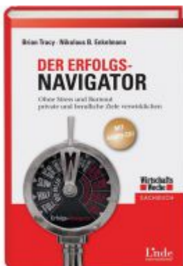
Der Erfolgs-Navigator Ladenpreis: 25,60 EUR