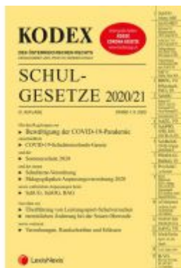
KODEX Schulgesetze 2020/21 Ladenpreis: 71,00 EUR