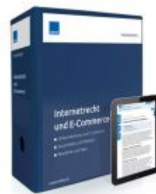
Internetrecht und E-Commerce Ladenpreis: 228,90 EUR