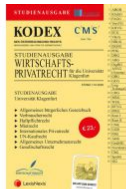
KODEX Wirtschaftsprivatrecht Klagenfurt Ladenpreis: 23,00 EUR