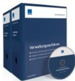
Mustersammlung Verwaltungsverfahren Ladenpreis: 228,90 EUR