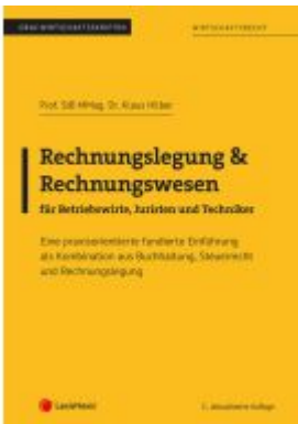
Rechnungslegung & Rechnungswesen für Betriebswirte, Juristen und Techniker Ladenpreis: 28,75EUR