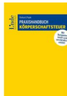
Praxishandbuch Körperschaftsteuer Ladenpreis: 59,00EUR