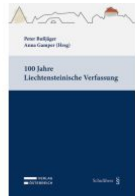
100 Jahre Liechtensteinische Verfassung Ladenpreis: 49,00EUR