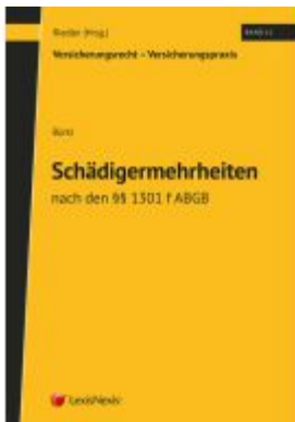
Schädigermehrheit nach den §§ 1301 f ABGB Ladenpreis: 69,00EUR