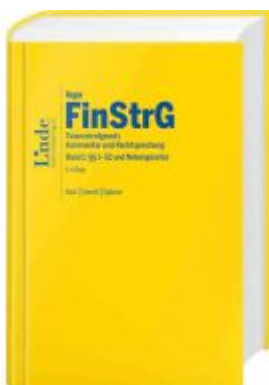
FinStrG | Finanzstrafgesetz Ladenpreis: 198,00EUR