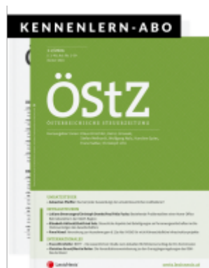
Kombi-Abo ÖStZ + ÖStZB - Kennenlern-Abo (4 ÖStZ Hefte + 4 ÖStZB Hefte) Ladenpreis: 90,00EUR