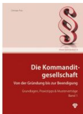
Die Kommanditgesellschaft Band 1 Ladenpreis: 78,00EUR