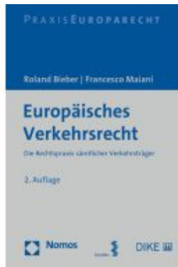
Europäisches Verkehrsrecht Ladenpreis: 91,50EUR