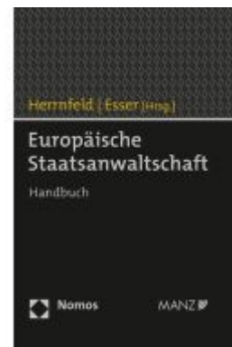
Europäische Staatsanwaltschaft Ladenpreis: 98,00EUR