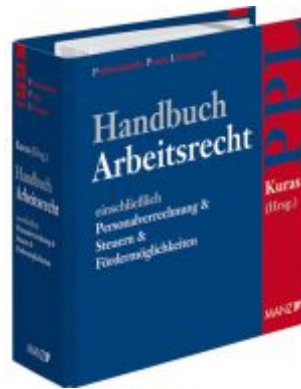
Handbuch Arbeitsrecht Ladenpreis: 198,00 EUR