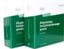
Allgemeines Sozialversicherungsgesetz Ladenpreis: 128,00 EUR