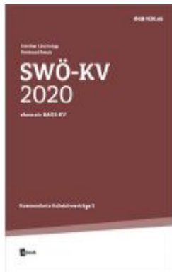
SWÖ-KV 2020 Ladenpreis: 29,90 EUR