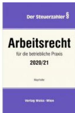
Arbeitsrecht für die betriebliche Praxis 2020/21 Ladenpreis: 85,80 EUR