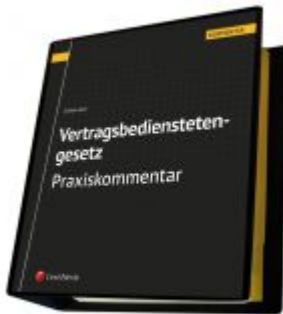
Vertragsbedienstetengesetz - Praxiskommentar Ladenpreis: 293,00 EUR