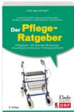
Der Pflege-Ratgeber Ladenpreis: 24,90 EUR