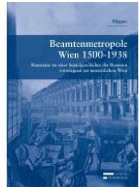
Beamtenmetropole Wien 1500-1938 Ladenpreis: 39,00 EUR