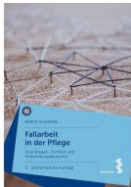
Fallararbeit in der Pflege Ladenpreis: 19,90 EUR