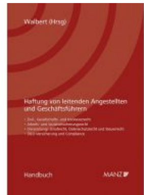
Haftung von leitenden Angestellten und Geschäftsführern Ladenpreis: 98,00 EUR