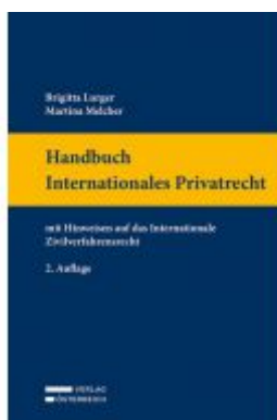
Handbuch Internationales Privatrecht Ladenpreis: 119,00EUR