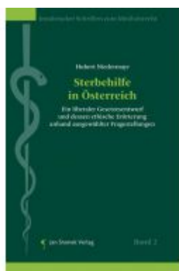
Sterbehilfe In Österreich Ladenpreis: 128,00EUR