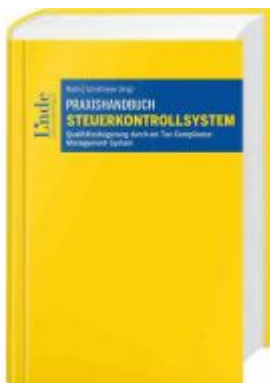
Praxishandbuch Steuerkontrollsystem Ladenpreis: 120,00EUR

Wir haben andere Produkte gefunden, die Ihnen gefallen könnten!