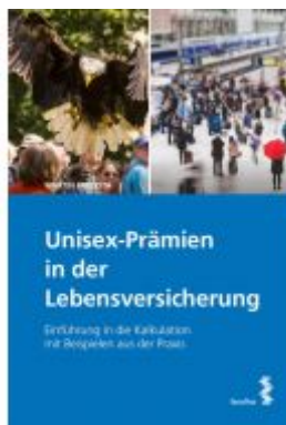
Unisex-Prämien in der Lebensversicherung Ladenpreis: 30,00EUR