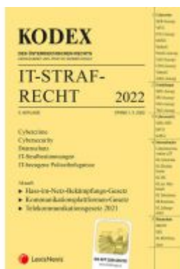
KODEX IT-Straf-Recht 2022 - inkl. App Ladenpreis: 30,00EUR