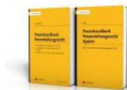
Praxishandbuch Veranstaltungsrecht + Update Ladenpreis: 79,00EUR