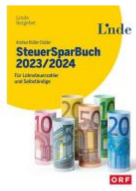
SteuerSparBuch 2023/2024 Ladenpreis: 29,90EUR