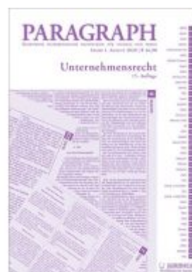
Paragraph - Unternehmensrecht Ladenpreis: 16,90 EUR