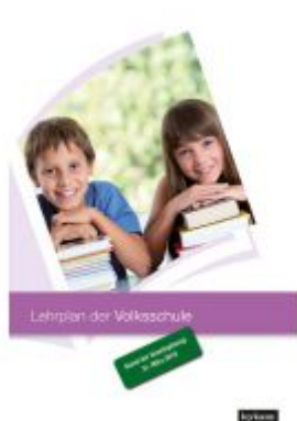
Lehrplan der Volksschule – Stand der Gesetzgebung: 31. März 2019 Ladenpreis: 24,90 EUR