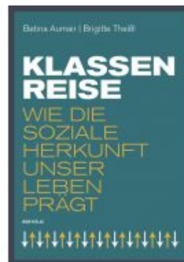
Klassenreise Ladenpreis: 19,90 EUR