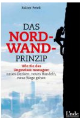
Das Nordwand-Prinzip Ladenpreis: 19,90 EUR