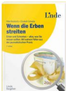
Wenn die Erben streiten Ladenpreis: 24,90 EUR

Wir haben andere Produkte gefunden, die Ihnen gefallen könnten!