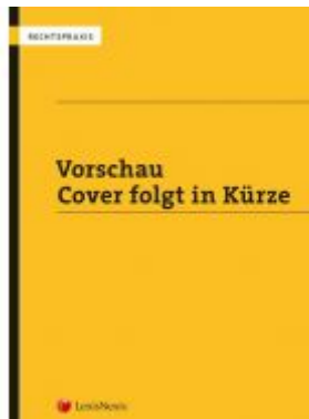
Wörterbuch Recht - Italienisch – Deutsch / Deutsch – Italienisch Ladenpreis: 49,00 EUR