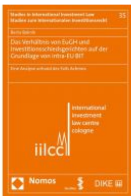
Das Verhältnis von EuGH und Investitionsschiedsgerichten auf der Grundlage von intra-EU BIT Ladenpreis: 100,80 EUR