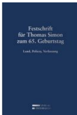
Festschrift für Thomas Simon zum 65. Geburtstag Ladenpreis: 109,00 EUR