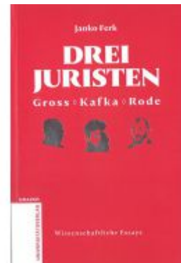
Drei Juristen - Gross - Kafka - Rode Ladenpreis: 12,90 EUR