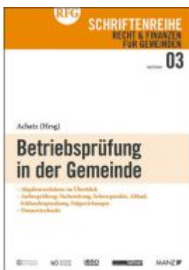
Betriebsprüfung in der Gemeinde Ladenpreis: 18,00 EUR