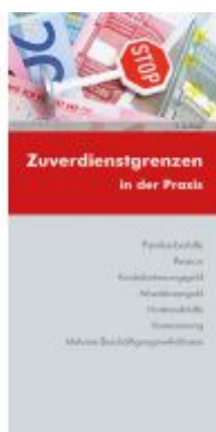
Zuverdienstgrenzen in der Praxis Ladenpreis: 13,20EUR