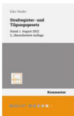
Strafregister- und Tilgungsgesetz Ladenpreis: 68,00EUR