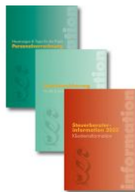
Steuerrechts-Paket 2023 Ladenpreis: 119,90EUR