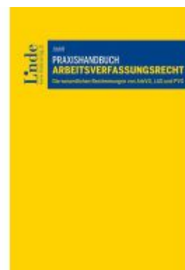
Praxishandbuch Arbeitsverfassungsrecht Ladenpreis: 79,00EUR