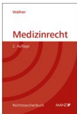
Medizinrecht Ladenpreis: 41,00EUR