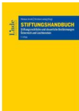
Stiftungshandbuch Ladenpreis: 110,00EUR