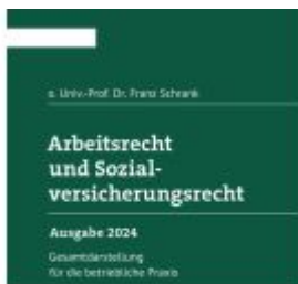
Arbeitsrecht und Sozialversicherungsrecht 2024 Ladenpreis: 373,00EUR

Wir haben andere Produkte gefunden, die Ihnen gefallen könnten!