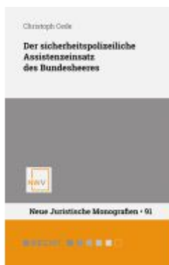
Der sicherheitspolizeiliche Assistenzeinsatz des Bundesheeres Ladenpreis: 68,00EUR