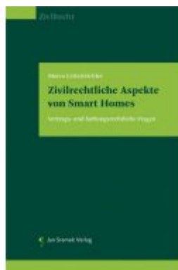
Zivilrechtliche Aspekte von Smart Homes Ladenpreis: 55,00EUR