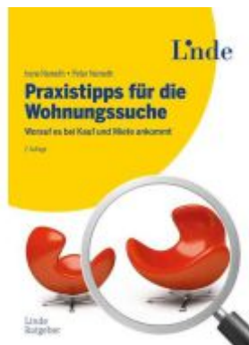
Praxistipps für die Wohnungssuche