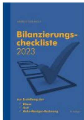
Bilanzierungscheckliste 2023 Ladenpreis: 14,85EUR