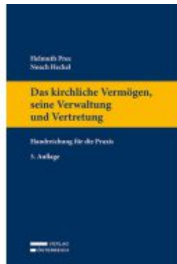
Das kirchliche Vermögen, seine Verwaltung und Vertretung Ladenpreis: 79,00EUR