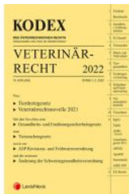
KODEX Veterinärrecht 2022