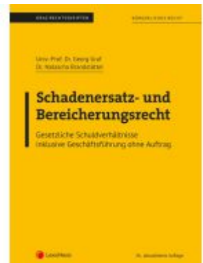
Bürgerliches Recht - Schadenersatz- und Bereicherungsrecht (Skriptum) Ladenpreis: 22,50EUR