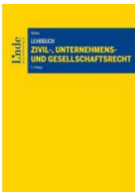
Lehrbuch Zivil-, Unternehmens- und Gesellschaftsrecht