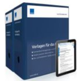
Vorlagen für das Notariat Ladenpreis: 261,80EUR