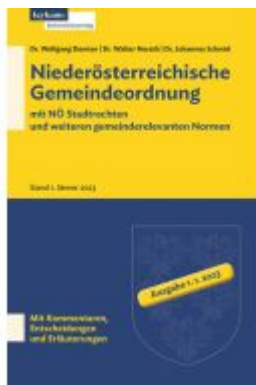
Niederösterreichische Gemeindeordnung mit NÖ Stadtrechten und weiteren gemeinderelevanten Normen Ladenpreis: 115,00EUR