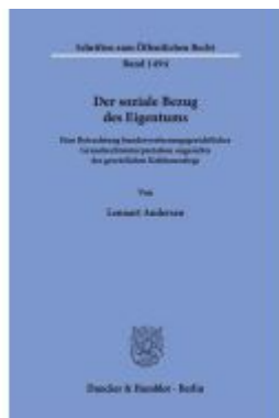
Der soziale Bezug des Eigentums. Ladenpreis: 102,70EUR