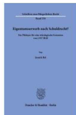
Eigentumserwerb nach Schuldrecht? Ladenpreis: 102,70EUR