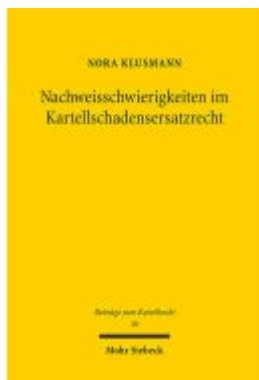
Nachweisschwierigkeiten im Kartellschadensersatzrecht Ladenpreis: 81,30EUR

Wir haben andere Produkte gefunden, die Ihnen gefallen könnten!