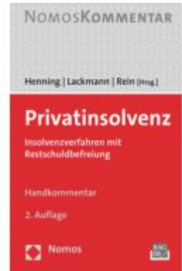
Privatin solvenz Ladenpreis: 132,70EUR