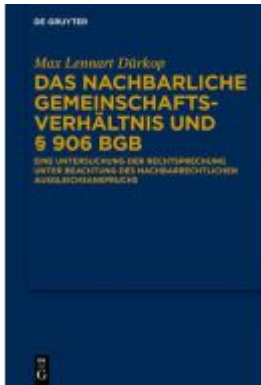
Das nachbarliche Gemeinschaftsverhältnis und § 906 BGB Ladenpreis: 89,95EUR