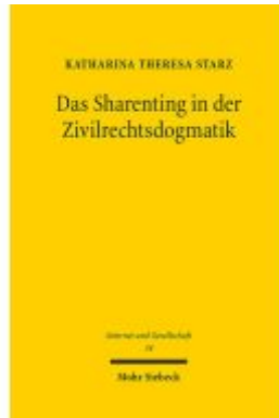
Das Sharenting in der Zivilrechtsdogmatik Ladenpreis: 81,30EUR