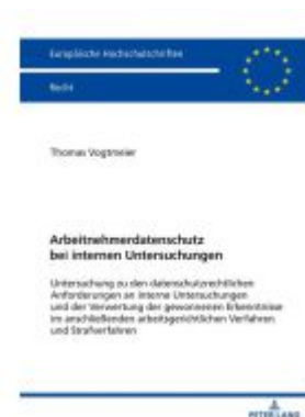
Arbeitnehmerdatenschutz bei internen Untersuchungen Ladenpreis: 126,50EUR