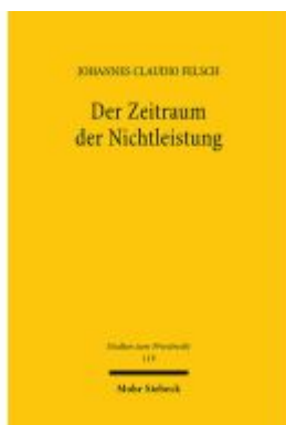
Der Zeitraum der Nichtleistung Ladenpreis: 107,00EUR