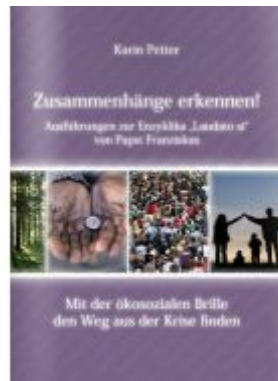
Zusammenhänge erkennen! Ladenpreis: 9,90 EUR