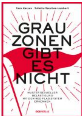
Grauzonen gibt es nicht Ladenpreis: 10,00 EUR

Wir haben andere Produkte gefunden, die Ihnen gefallen könnten!