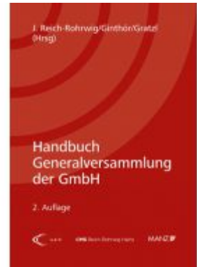
Handbuch Generalversammlung der GmbH Ladenpreis: 78,00 EUR