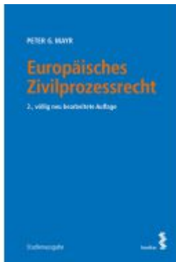
Europäisches Zivilprozessrecht Ladenpreis: 46,00 EUR

Wir haben andere Produkte gefunden, die Ihnen gefallen könnten!