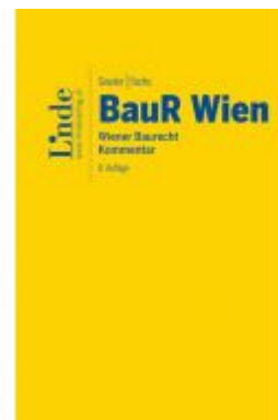
BauR Wien | Wiener Baurecht Ladenpreis: 120,00 EUR