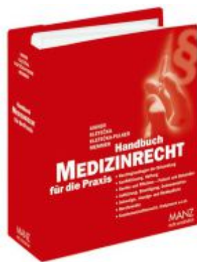
Handbuch Medizinrecht für die Praxis Ladenpreis: 198,00 EUR