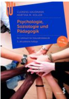
Psychologie, Soziologie und Pädagogik Ladenpreis: 24,90 EUR