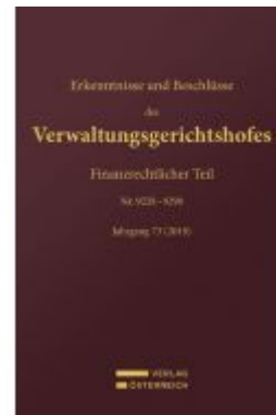
Erkenntnisse und Beschlüsse des Verwaltungsgerichtshofes Ladenpreis: 148,00 EUR