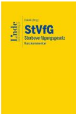
StVfG | Sterbeverfügungsgesetz Ladenpreis: 39,00 EUR