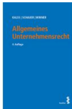
Allgemeines Unternehmensrecht Ladenpreis: 43,00 EUR