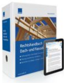
Rechtshandbuch Dach- und Fassadenbau Ladenpreis: 239,80 EUR