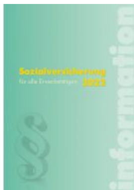
Sozialversicherung 2022 Ladenpreis: 48,00 EUR