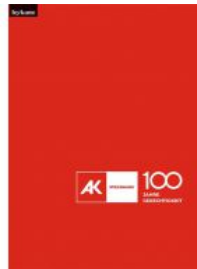
Festschrift Arbeiterkammer Steiermark – 100 Jahre Gerechtigkeit Ladenpreis: 30,00 EUR