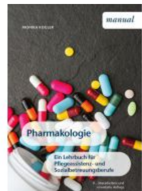
Pharmakologie Ladenpreis: 22,90 EUR