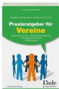
Praxisratgeber für Vereine Ladenpreis: 24,90 EUR