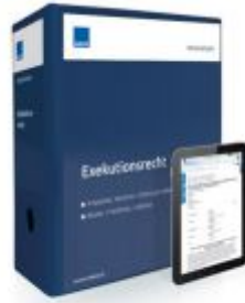
Exekutionsrecht Ladenpreis: 250,80 EUR