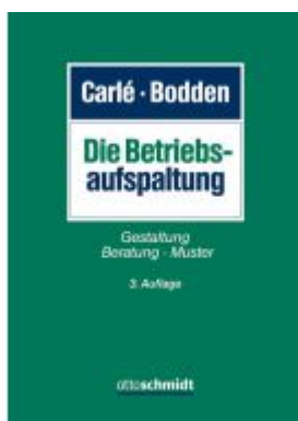
Die Betriebsaufspaltung Ladenpreis: 100,80EUR