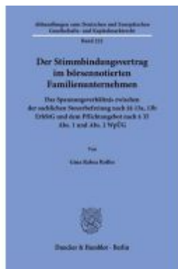
Der Stimmbindungsvertrag im börsennotierten Familienunternehmen. Ladenpreis: 92,50EUR