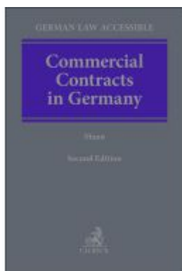
Commercial Contracts in Germany