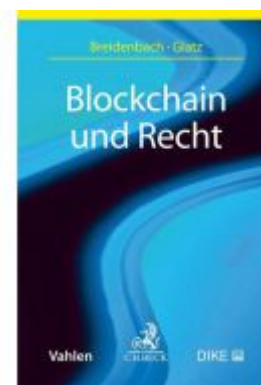
Blockchain und Recht