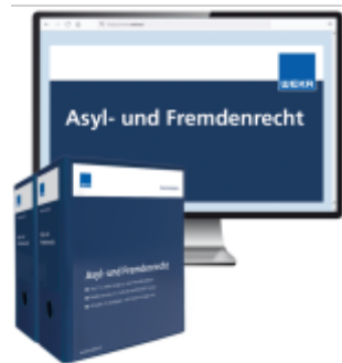
Asyl- und Fremdenrecht Ladenpreis: 261,80EUR