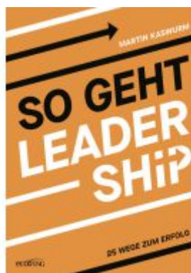
So geht Leadership