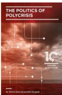
The Politics of Polycrisis Ladenpreis: 12,40EUR