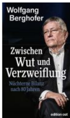
Zwischen Wut und Verzweiflung Ladenpreis: 18,50EUR