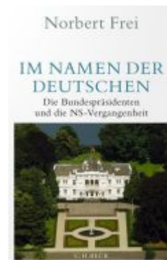
Im Namen der Deutschen Ladenpreis: 28,80EUR