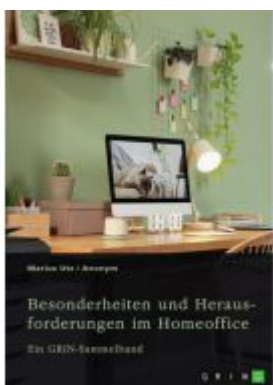
Besonderheiten und Herausforderungen im Homeoffice. Untersuchungen aus arbeitsrechtlicher und gesundheitlicher Sicht Ladenpreis: 42,95EUR