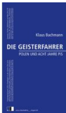
DIE GEISTERFAHRER Ladenpreis: 15,50EUR