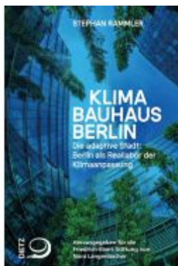
Klimabauhaus Berlin Ladenpreis: 16,50EUR