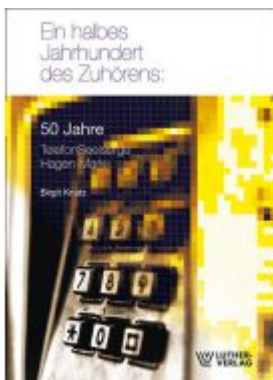
Ein halbes Jahrhundert des Zuhörens Ladenpreis: 15,50EUR

Wir haben andere Produkte gefunden, die Ihnen gefallen könnten!