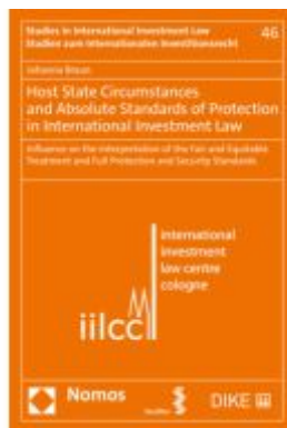
Host State Circumstances and Absolute Standards of Protection in International Investment Law Ladenpreis: 71,00EUR