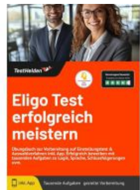
Eligo Test erfolgreich meistern: Übungsbuch zur Vorbereitung auf Einstellungstest & Auswahlverfahren inkl. App. Erfolgreich bewerben mit tausenden Aufgaben zu Logik, Sprache, Schlussfolgerungen uvm. Ladenpreis: 41,10EUR